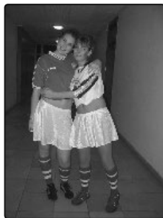
GF-Sisters Samlet nr. 3, men bedste tekst og sceneshow

Vi går om bag scenen igen og braser syngende ind i nr. 31, der i dagens anledning fungerer som backstagelokale. Heromme sidder drengene fra 3rd DeGree og drikker sig en kæp i øret, mens the Nuzziboyes smører sig ind i glimmer. I det hele taget er der god stemning omkring de heltulovligt indsmuglede øl. Vi sætter os ved et bord, klapper hinanden på skuldrene og erklærer, at de øvrige bandmedlemmer garanteret har gjort deres