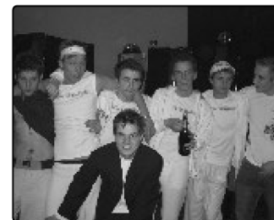
3rd DeGree-vinderne: "Mærk mine kærtegn!"